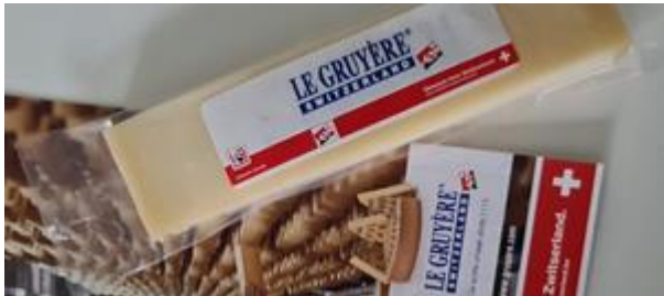
Don de gruyère (20/10/23)