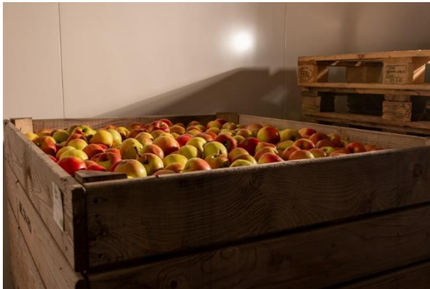
Achat de pomme 2 e choix