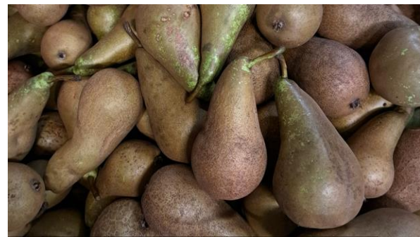
Achat poires 2 e choix