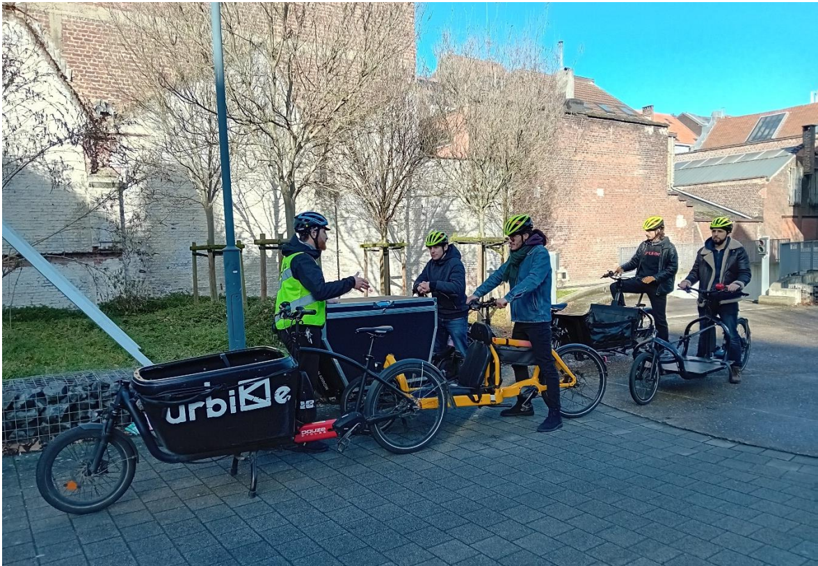
Formation Vélo cargo avec Urbike (février 2024)