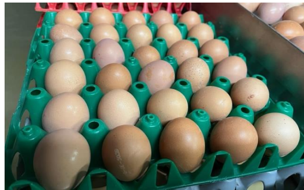
Achat d'œufs 2 e choix