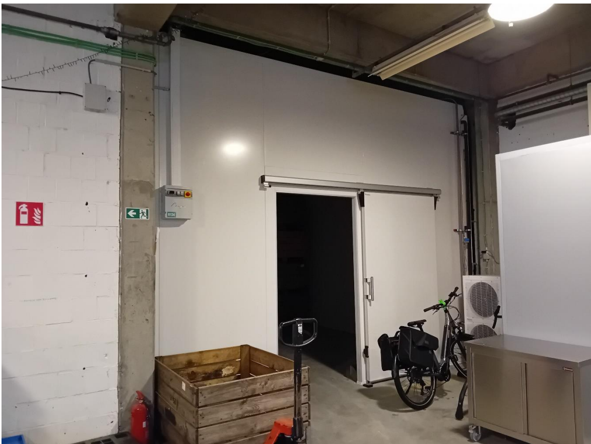
Nouvelle chambre froide installée chez NOJAVEL!