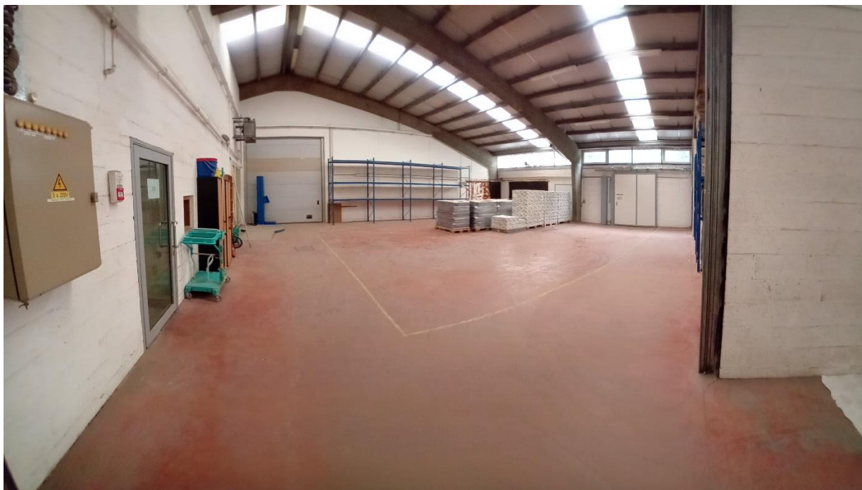
Entrepôt APAM loué de juillet à décembre 2023