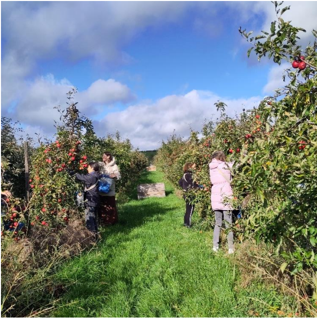
Glanage de pommes avec NOJAVEL ! (23/10/23)